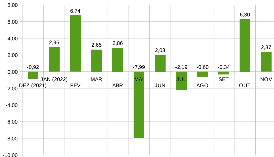
Figura 2 - Comportamento do custo da cesta básica no período compreendido entre dezembro de 2021 e novembro de 2022.

Em relação ao custo da cesta básica em Viçosa, o mesmo também apresentou alta no mês corrente, com variação de 2,37%. Embora em menor intensidade do que no mês anterior, foi a segunda elevação após três reduções consecutivas (Figura 2).