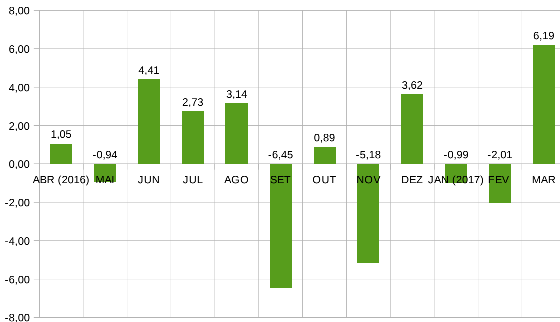
Figura 1 - Comportamento do custo da cesta básica no período compreendido entre abril de 2016 e março de 2017.